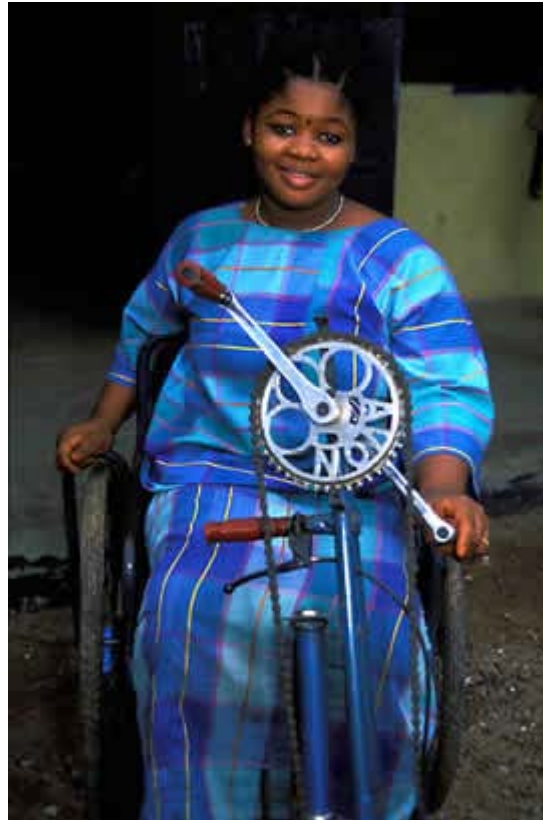
Disabili in Sierra Leone 2003 anno internazionale dei disabili

Per non dimenticare l'Africa L'ambiente in pericolo L'amicizia Gli avvenimenti La Comunità di Sant'Egidio I disabili La guerra e la pace I popoli della Terra