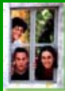
C'è ancora posto!