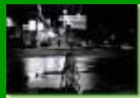
Disabili a Mosca