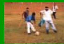
Partita di calcio