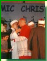
Abbraccio di pace