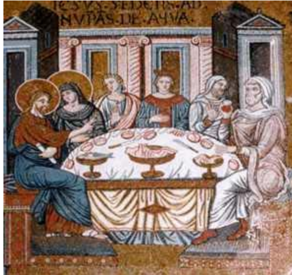
[Banchetto nuziale - Duomo di Monreale - Palermo]