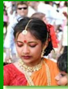
I popoli della Terra (India)