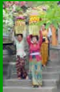
I popoli della Terra (Indonesia)