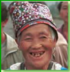
I popoli della Terra (Cina)