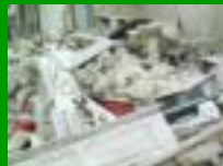
Terremoto in Italia