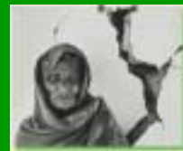
L'ambiente in pericolo: il terremoto