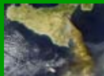
L'eruzione dell'Etna vista dal satellite