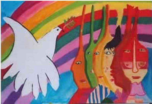
Visualizza l'immagine ingrandita Gli uomini uguali Pastelli acquerellabili su carta 2002