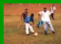
Partita di calcio