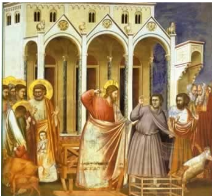
[Giotto, la cacciata dei mercanti dal Tempio, Cappella degli Scrovegni, Padova]