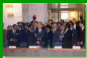
Mozambico 10 anni di pace