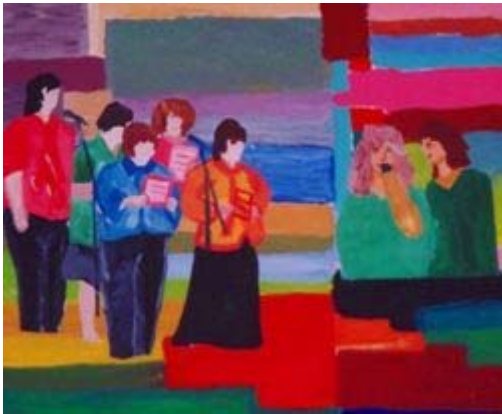
Visualizza l'immagine ingrandita Cantiamo insieme a Gli Amici ! Colori acrilici su carta 2001

L'artista, che è una persona Down ed ha qualche difficoltà nel rappresentare correttamente lo spazio, ha realizzato le figure umane con l'aiuto delle sagome pretagliate : nella parte sinistra del dipinto il coro canta con grande impegno, come si nota dalla posizione del capo dei cantanti, intenti a guardare il foglio che tengono tra le mani, mentre sulla destra la cantante solista si esibisce sostenuta dall'incoraggiamento di una amica. Le due scene si stagliano su uno sfondo coloratissimo, realizzato pazientemente dall'autore accostando tanti rettangoli di tinte e dimensioni diverse. Attraverso un'equilibrata combinazione di toni caldi e freddi Ciro è riuscito a dare profondità alla scena, e, concentrando le tinte più chiare al centro della composizione, ha creato un effetto