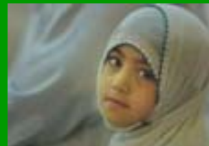
I popoli della Terra (Iraq)