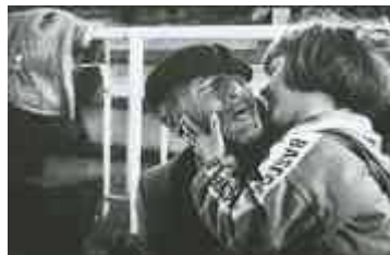
Nonno e nipote