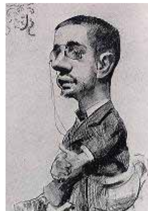
Autoritratto in caricatura, 1882

I ritratti che egli fece ad amici o personaggi noti di Parigi, sembravano a volte delle caricature: in realtà era come se egli riuscisse a svelare quello che la gente di solito cerca di nascondere: la vanità, l'avidità, le debolezze. Forse proprio perché egli stesso era debole nel corpo, non aveva paura della debolezza degli altri. Le persone che egli ritrasse perciò non sono sempre belle, a volte si percepisce che erano vanitose o che avevano paura. Questi ritratti mostrano come Toulouse Lautrec fosse capace di comprendere le persone in profondità. Anche di se stesso fece spesso delle caricature in cui si prendeva in giro.