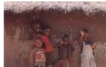
Le guerre dimenticate: l'Uganda