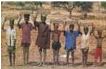
Il lavoro dei bambini

Al banchetto della frutta a San Salvador