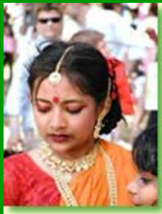
I popoli della Terra (India)