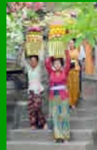
I popoli della Terra (Bali - Indonesia)