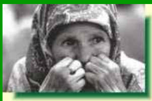
Il dolore per la guerra