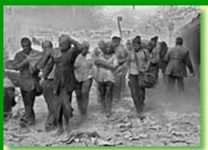
11 settembre 2001