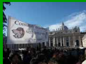
Marcia per la pace