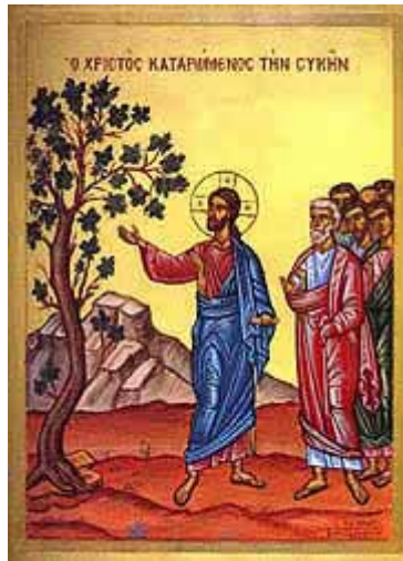
[Icona Fico Sterile]