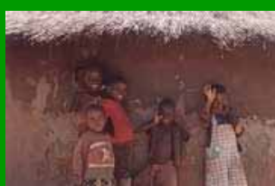
Le guerre dimenticate: l'Uganda