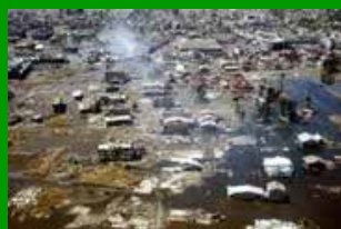
Il maremoto nel sud-est asiatico