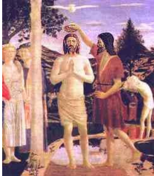
[Piero della Francesca, Battesimo, Londra]