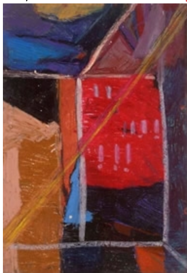
Visualizza l'immagine ingrandita La finestra sul cortile Pastelli ad olio su carta 2004